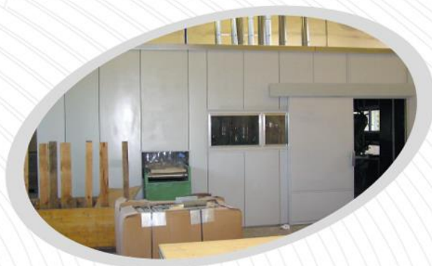
Návrhy a provedení úprav na snížení hluku