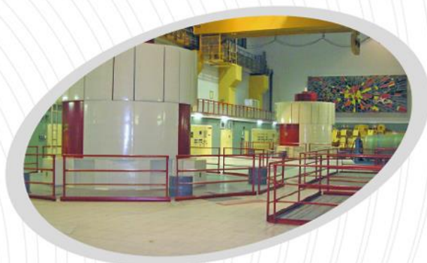
Diagnostické měření hluku velkých elektrických strojů